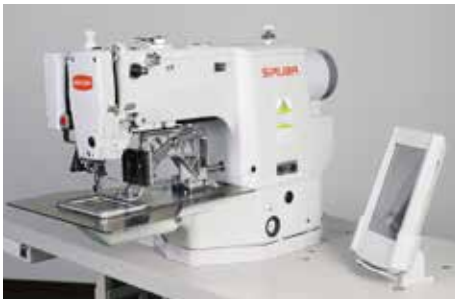
BT630A Máy hoa văn nhỏ