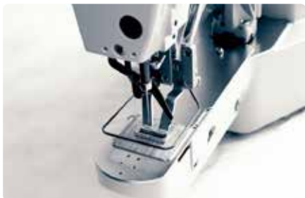
BT430A-01 / 02